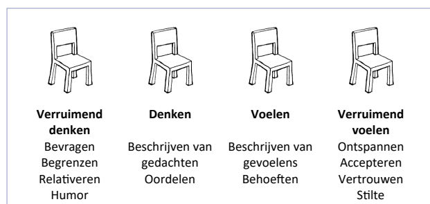
Figuur 2. Het vierstoelenmodel.

Het vierstoelenmodel is een dynamisch en fysiek reflectiemodel, bruikbaar voor coaching en intervisie, om stil te staan bij wat er in je leeft en hoe dat doorwerkt in je interacties. Het gaat om een beweging naar binnen die je in contact met jezelf en met de ander naar buiten brengt. Een van de uitgangspunten is, dat de interne dialoog die zichtbaar wordt op de stoelen de externe dialoog met mensen om je heen beïnvloedt en vice versa. Het begint met het neerzetten van vier stoelen op een rij. Iedere stoel vertegenwoordigt een positie in je interne dialoog. De persoon die iets inbrengt, beweegt zich letterlijk van stoel naar stoel, corresponderend met de inhoud van het verhaal.