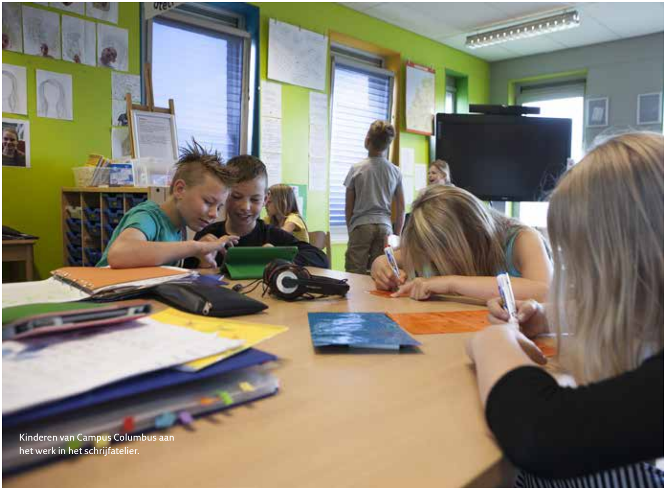
Kinderen van Campus Columbus aan het werk in het schrijfatelier.

om geen toneelstukje te spelen maar gewoon jezelf te zijn. Omdat dat veel relaxter is.'