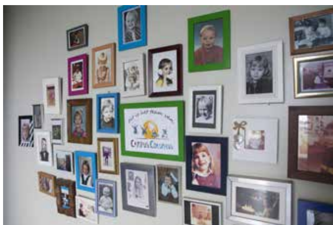
Foto's van de teamleden van Campus Columbus, toen ze zelf nog jong waren