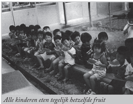
Alle kinderen eten tegelijk hetzelfde fruit

Het is niet eenvoudig om in een paar zinnen de Japanse cultuur te beschrijven, waar het onderwijs deel van uit maakt.